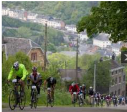
De laatste klim, diepte-opname.

De laatste klim was voorzien, maar blijft iedere keer weer een lastige steile klim, waarbij het gemiddelde zelfs nog wat omlaag wordt gehaald. Het ultieme genot als je boven bent om nog even naar beneden te donderen op weg naar het verdiende Chouffe.