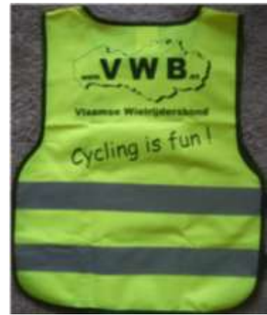
presentje na de tocht.