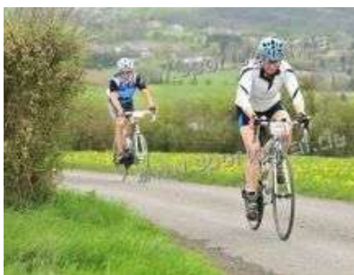
Zelfde passeerpunt: 14:19 en 14:57 uur.