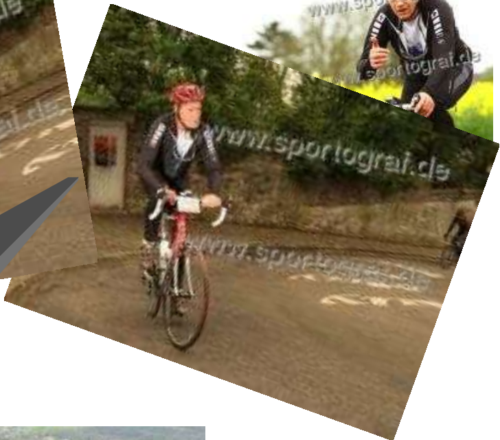
Muur van Huy