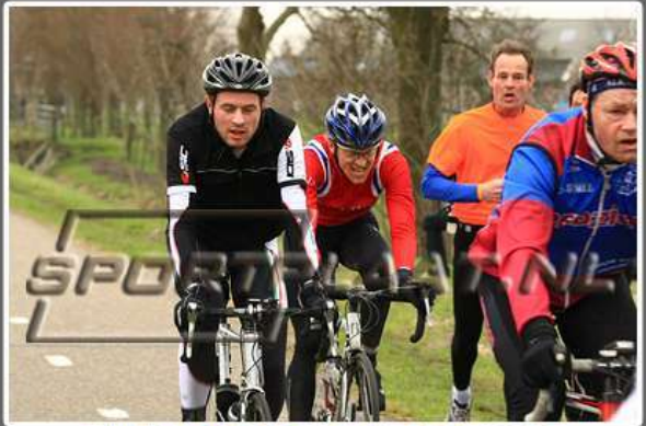
WITTE KRUIS CLASSIC TOERTOCHT, 10 MAART 2012

Je kunt hier wel zien dat het de laatste, snelle loodjes zijn!