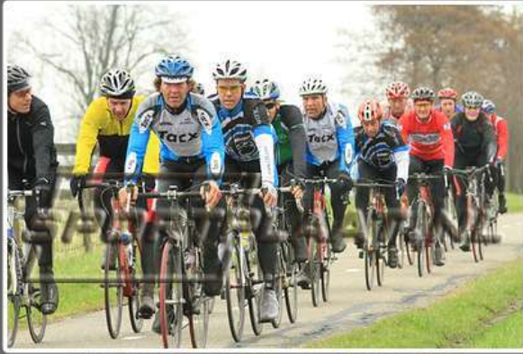
WITTE KRUIS CLASSIC TOERTOCHT, 10 MAART 2012