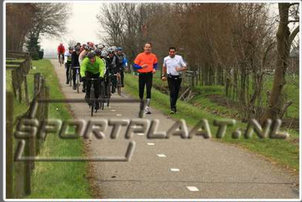
WITTE KRUIS CLASSIC TOERTOCHT, 10 MAART 2012