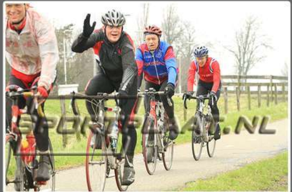
WITTE KRUIS CLASSIC TOERTOCHT, 10 MAART 2012

Voor meer sportplaat foto's zie: Afbeeldingen/2012/ 120310 WKC of via de link achter 'Met:'.