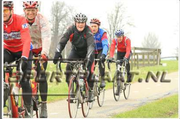
WITTE KRUIS CLASSIC TOERTOCHT, 10 MAART 2012