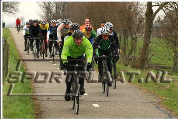
WITTE KRUIS CLASSIC TOERTOCHT, 10 MAART 2012