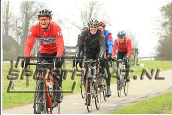
WITTE KRUIS CLASSIC TOERTOCHT, 10 MAART 2012