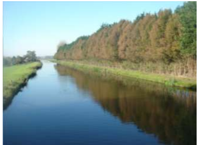
Zie de maan nog boven de bomenrij.

Zo genoten we van de uitzichten met een al komend herfstpallet aan kleuren, de gezonde buitenlucht, maar ook de doorkijkjes door de plaatsen waar we doorheen reden. Verbazingwekkend was het aantal hardlopers dat we tegen kwamen, zowel vermoedelijk in een tocht als loslopend, nabij Zoeterwoude.