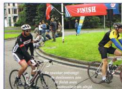
De speaker ontvangt de deelnemers aan de finish even enthousiast als altijd.