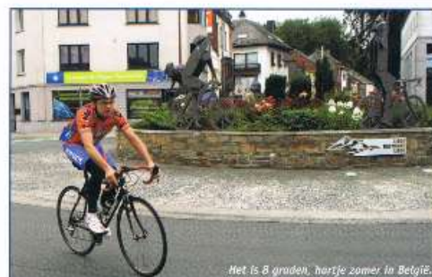
Het is 8 graden, hartje zomer in België.