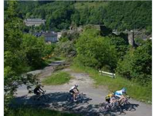
De La Chouffe Classic werd gereden onder een staalblauwe hemel.

Vroeg verzameld in De Meern (4:30 uur), waarna met een voorspoedige reis - de wereld is inderdaad verbeterd met de snelweg door Eindhoven - we op de starttijd aan de tocht konden beginnen. Ondanks de tegenvallende temperatuur en met het vooruitzicht op niet snel stijgende temperaturen, een wat gure wind en later te verwachten bewolking hebben we ons gewoon warm aangekleed. Dit bleek achteraf ook de goede keuze te zijn geweest, want echt warm is het niet geworden.