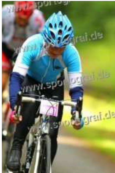
Foto's La Chouffe Classic 28-05-2011 :