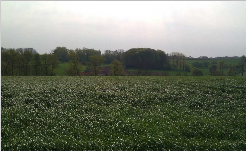
Uitzicht bij “Pech onderweg”