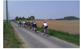
Diverse groepen zonder reservewiel of mededogen; sommige wel met humor.