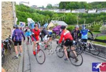
Fotonummer 49359708 Bild-Uhrzeit 09:36:12