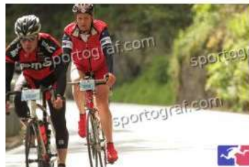
Fotonummer 49370192 Bild-Uhrzeit 10:01:10