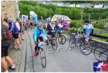
Fotonummer 49363983 Bild-Uhrzeit 09:36:17