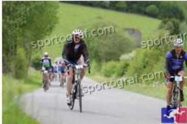
Fotonummer 49357877 Bild-Uhrzeit 15:25:40