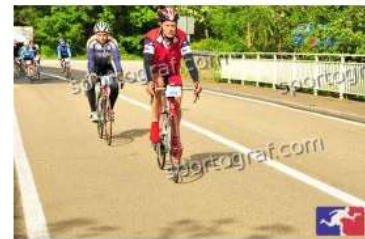
Fotonummer 49339505 Bild-Uhrzeit 10:01:25