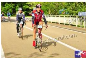
Fotonummer 49336242 Bild-Uhrzeit 10:01:26