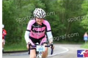
Fotonummer 49348805 Bild-Uhrzeit 10:07:35