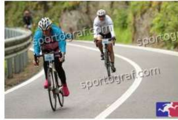
Fotonummer 49368569 Bild-Uhrzeit 10:03:39