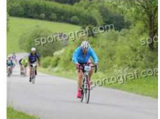
Fotonummer 49351978 Bild-Uhrzeit 15:25:35