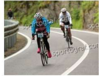
Fotonummer 49370368 Bild-Uhrzeit 10:03:39