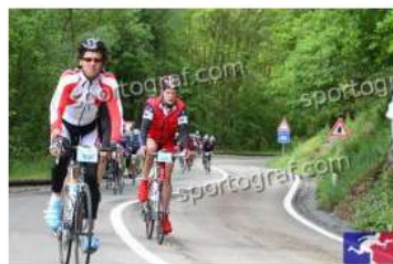
Fotonummer 49347830 Bild-Uhrzeit 10:01:59