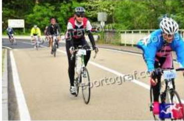
Fotonummer 49334999 Bild-Uhrzeit 10:03:56