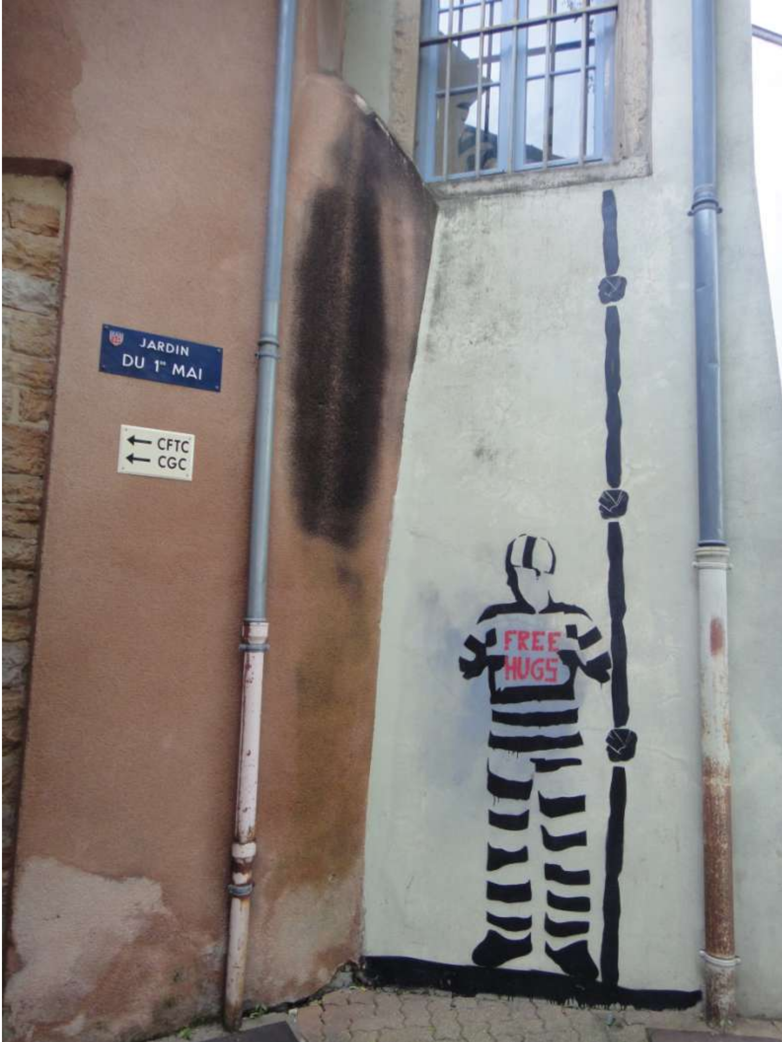
Macon-Frankrijk, mei 2014