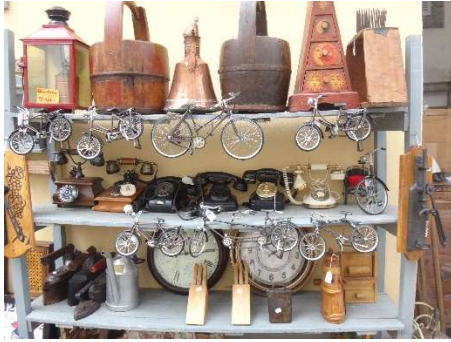
souvenirtjes en nonnen