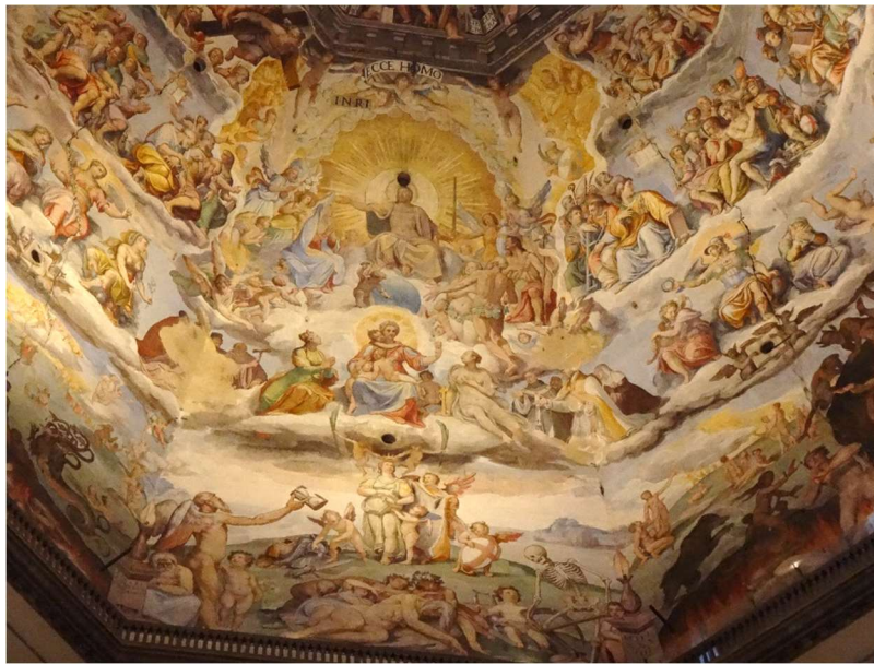
PRACHT EN PRAAL:

3-7-2017 EN VANZELFSPREKEND HEBBEN WE OOK FLORENCE BEZOCHT: