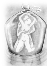
Message in a bottle - the Police

Fields of Gold, zijn landgoed passend in een decor vaak onder de okeren gloed een weldadige oase voor de tenor rust en weelde wat een vrijheid met wijn die de tong streelde al door olijven geplaveid ver van waar de mannen oreren waar de wereld stilstaat bloei, groei, produceren in de maat waarin de muziek slaat soms loom en ontoegankelijk vaak intens teder en afstandelijk meeslepend en immens totaal overgeleverd aan deze vrede waardevoller dan gelden daarvan zingt Sting tevreden tussen zijn gouden velden.