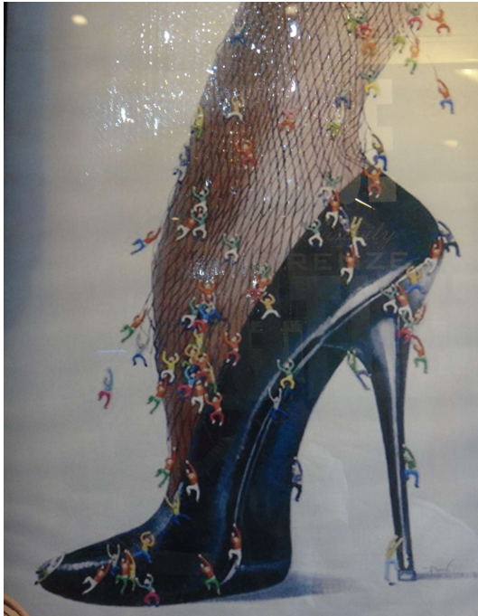
Nieuwe schoenen, altijd welkom, alhoewel het lijkt wel wat op Gulliver's Travels.

Natuurlijk moest ieder zijn ding doen, dus Anja in de loopspas en ik een "klein rondje" op de MTB. Een prachtig gebied met een lange klim en onderweg, net in de berm, geschrokken <wederzijds> van 2 zwijnen. Zij stoven weg.