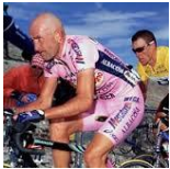
naamgever: Marco Pantani

Zo ook "Il Pirata" zwaar al op voorhand drukverhogend tevoren zenuwtergend aan de start verlossend de aanloopfase en het losgaan bij de eerste hoogtemeters.