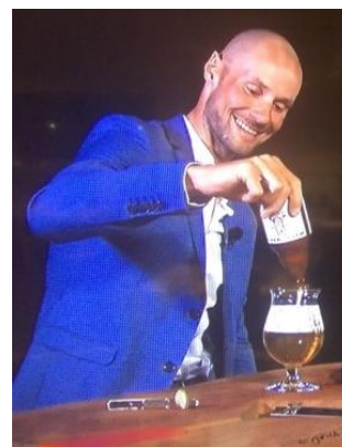
Alsof de Duvel er (al) mee speelde?