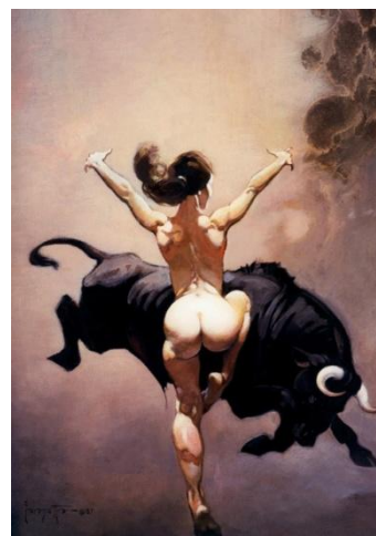
Slappe Zakken - Hassnae Bouazza Illustratie: Frank Frazetta

Hopelijk wordt in het land van deze dwazen, het oude nieuws rond 'Slappe Zakken' 2 weggeblazen.