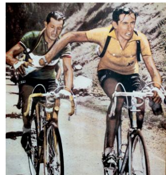
Coppi en Bartoli

Daarbij komt hij op zijn reis in een gemoedstoestand die niet te beschrijven is met verstand, noch te verkrijgen voor 'geen enkele' prijs.