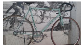
Fiets van Coppi

Een pelgrim is op zoek naar een plek, hij kan niet terug in de tijd, hij zoekt zijn alter-ego die hij benijdt, een vreemd soort karaktertrek.