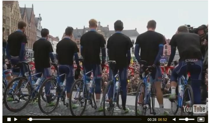
Van de minuut stilte op de Grote Markt in Brugge tot de winnende solo van Peter Sagan in Oudenaarde. Dit is in vogelvlucht de honderdste editie van de Ronde van Vlaanderen. 06:52