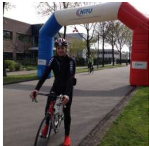
Tevreden over de finish.