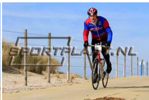
Een goed begin van de fietstochten in 2014!