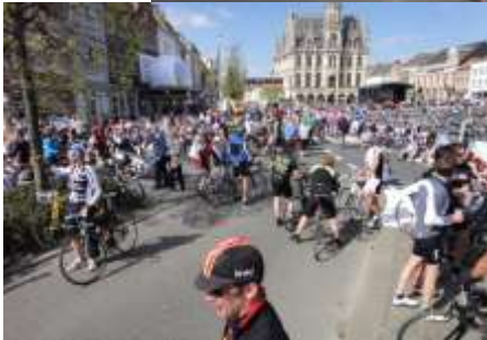
De Ronde van Vlaanderen 2014