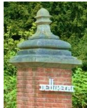
Een hele reis: Utrecht naar Barcelona.