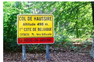
Natuurlijk hét hoogtepunt Col de Haussire

Over de tocht zelf kan ik kort zijn: mooi, mooier, mooist. Geweldige afdalingen, soepele klimmen en een paar echte kuitbijters, magnifieke uitzichten, leuke dorpjes/plaatsjes, sportievelingen om je heen en een fantastische verzorgingsposten (al waren die, anders dan bij andere tochten, pas om de 60 km) en dan het stralende weer met een aangename fietstemperatuur. Kortom een TOP-dag.