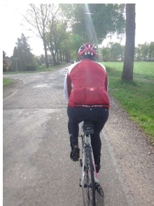
Met nieuwe (bij- en passende) helm.