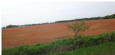
Tot de volgende tocht.