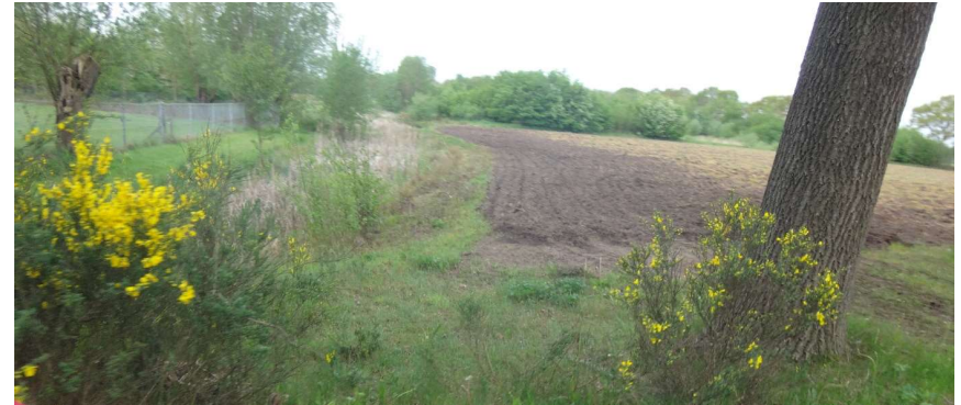
Brem in bloei op de eerste kilometers van de tocht.

dan vlak voor Asten de aansluiting weer te zoeken met het 120 km-parcours (Zie kaartje: weg met pijltje naar het rode parcours). Inventief als ze is, werd de eerste weg links na en langs het kanaal door haar gekozen en dan rechts links rechts kwam ze natuurlijk ook weer op het juiste traject terecht. Dat zou ze niet volhouden door het gemis/c.q. het missen van bordjes. De overschrijding van 2 km van de grans van 100 km en een pauze van enkele minuten op een bankje in de wei zorgden ervoor dat ze net 9 minuten voor mij binnen was. Hoefde ze gelukkig niet al te lang te wachten.