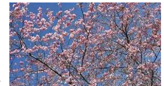
Lentepracht in overvloed.

De wegen leeg, geen vlagvertoon een diepe rust in dit landschap, het lijkt wel uitgestorven in de vroege morgen.