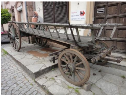
OUDE WAGENS PIEPEN HET HARDST.

Hierna ook geen zin meer om tussen de andere groepen in te gaan zitten, alleen. Dus auto in en naar het hotel. Hier lekker gedoucht en bijgekomen onder het genot van een Battin aan tafel. Het eten liet wat op zich wachten, wat allerminst erg was. Een TRUITE MET FRIET . Daarna op tijd naar bed.