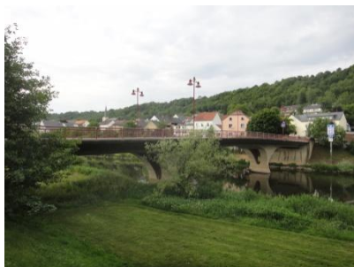
Le pont Wallendorf